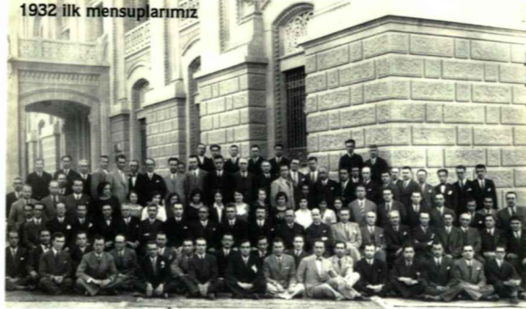
1932 ilk mensuplarımız

Kuruluş Kanununa göre, Banka Umum Müdürlük olarak teşkilatlandırılmıştı. Bankanın temel organı Hissedarlar Umumi Heyetiydi. Bunun dışında diğer organlar; Bankanın en yüksek yönetim organı olan İdare Meclisi, denetleme görevini yürüten Murakıplar Komisyonu, iskonto, faiz hadleri ve kredi