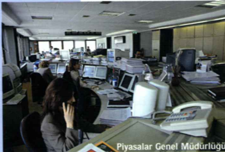
Piyasalar Genel Müdürlüğü

“1980’li yıllarda Banka, para ve döviz piyasalarının oluşturulmasında öncü rol üstlendi.”