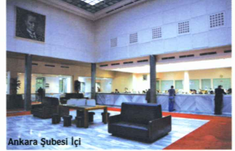
Ankara Şubesi İçi

1994 yılında yaşanan ekonomik kriz aynı zamanda Merkez Bankası bağımsızlığının tartışılmaya başlamasına neden oldu. Bankanın yasal statüsünün yanı sıra, Hazine ile olan ilişkileri gündeme geldi ve bağımsız bir Merkez Bankasına duyulan ihtiyaç dile getirilmeye başlandı. Bu krizin ve tartışmaların bir yansıması olarak, 21 Nisan 1994 tarihinde Merkez Bankası Kanununun Hazineye kısa vadeli avans hesabını düzenleyen maddesinde değişiklik yapılarak Hazinesinin Merkez Bankası kaynaklarını kullanımına sınırlamalar getirildi. 1997 yılında ise Merkez Bankası ile Hazine arasında bir protokol imzalanarak, Hazinesinin Merkez Bankasından kısa vadeli avans kullanmaması konusunda bir mutabakat sağlandı.