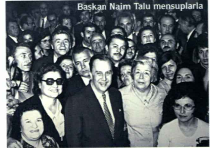
Başkan Naim Talu mensuplarla

1980’li yıllar hem Türkiye ekonomisi hem de Merkez Bankası için dönüm noktası sayılabilecek gelişmelerin yaşandığı yıllar oldu. 24 Ocak 1980 kararları ile sabit kur rejimi terk edilerek, finansal sistemin serbestleştirilmesi amacıyla kredi ve mevduat faizleri üzerindeki sınırlamalar kaldırıldı. Merkez Bankası döviz kurlarının belirlenmesi ile yetkilendirildi ve 1981 yılı Mayıs ayından itibaren döviz kurları günlük olarak tespit edilmeye başlandı.