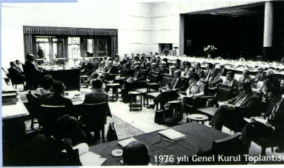
1976 yılı Genel Kurul Toplantısı

Bankanın temel görev ve yetkilerinde de önemli değişimler gerçekleşti. İlk olarak para politikalarının doğrudan ve dolaylı belirlenme yetkisi önemli ölçüde Merkez Bankasının kontrolüne geçti ve “para ve kredi politikalarını kalkınma planları ve yıllık programlara uygun bir tarzda yürütmek” Bankanın görev ve yetkileri arasında sayıldı. Kanunda göze çarpan bir diğer önemli yenilik ise Bankaya para arzını ve likiditeyi düzenlemek amacıyla açık piyasa işlemleri yapma yetkisinin verilmesiydi. Bu madde ile modern bir para politikası aracı olan açık piyasa işlemleri gündeme geldi. Ayrıca yatırımları ve ekonomik