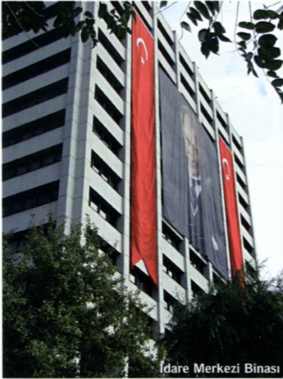
İdare Merkezi Binası