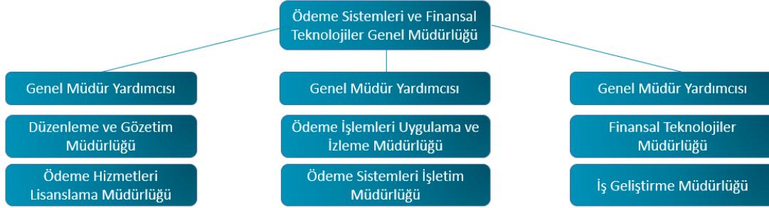
Şekil-2: TCMB Ödeme Sistemleri ve Finansal Teknolojiler Genel Müdürlüğü Organizasyon Yapısı

TCMB Ödeme Sistemlerinin kurulması, etkin ve verimli bir şekilde işletilmesi, belirlenen politikalar çerçevesinde geliştirilmesi ve ülkemizdeki ödeme ve menkul kıymet mutabakat sistemlerinin gözetimi Ödeme Sistemleri ve Finansal Teknolojiler Genel Müdürlüğü'nün sorumluluğundadır. Genel Müdürlüğü'nün organizasyon yapısı Şekil 2'de verilmiştir.